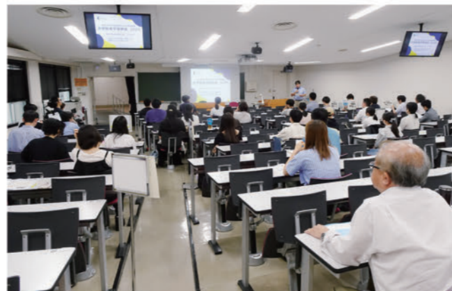
2025年度実施時の様子

第2回 2026年 10月下旬を予定 ※オンライン形式 (具体的な日付についてはホームページでお知らせします。)